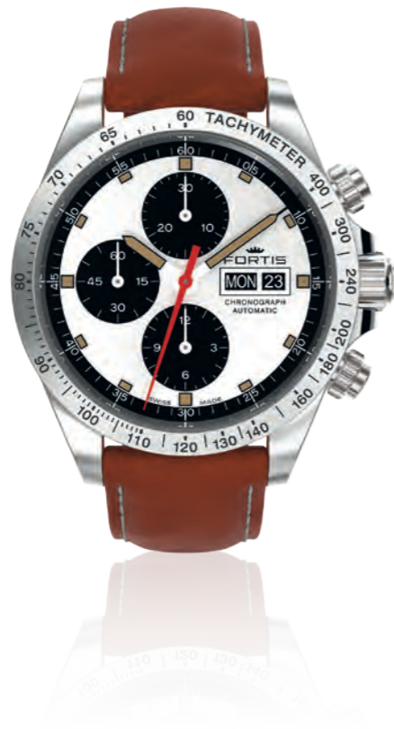
Stratoliner Parabola Limited Edition 200 pcs.