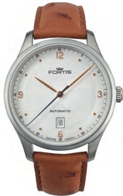
Tycoon Date a.m.