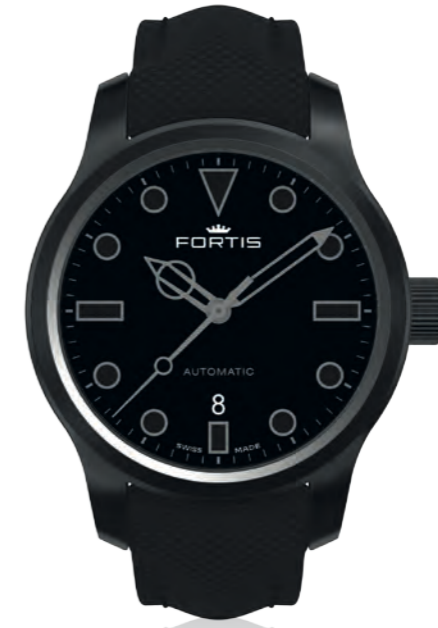
Shoreliner Vik Beach p.m.

42mm Edelstahlgehäuse PVD beschichtet · erhabene schwarze Indexe weiß gerahmt · weiße Skelett-Zeiger mit Superluminova-Beschichtung blau nachleuchtend · weißer Sekundenzeiger mit Superluminova-Beschichtung blau nachleuchtend mit Bullauge in schwarz · matt schwarzes Ziffernblatt · beidseitig entspiegeltes Saphirglas · Schweizer Automatikwerk ETA 2836 elaboré · Datumsanzeige · Glasboden · beidseitig entspiegeltes Saphirglas · 20 bar wasserdicht