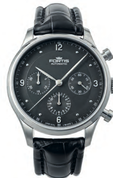
Tycoon Chronograph p.m.

41mm flaches Edelstahlgehäuse (teils gebürstet, teils poliert) · bombiertes Saphirglas · Schweizer Automatikwerk Dubois-Depraz 2020 · bombiertes silber-opalines Ziffernblatt · erhabene Ziffern und Indexe 5N Gold beschichtet · 5N Gold beschichtete Feuille-Zeiger · gebläute Zeiger · Chronograph · verschraubter Glasboden · 5 bar wasserdicht