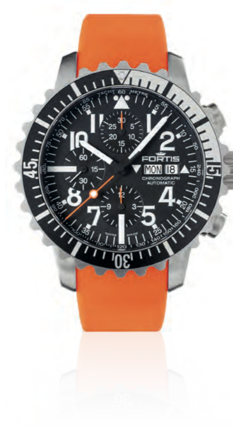
Marinemaster Classic Chronograph

42mm Edelstahlgehäuse (gebürstet) · rutschfeste Drehlunette mit Superluminova-Punkt · Schweizer Automatikwerk ETA 2836 elaboré · Tages- und Datumsanzeige · weiße Zahlen, Indexe und Zeiger mit Superluminova-Beschichtung blau nachleuchtend · orangefarbener Sekundenzeiger mit Bullauge Superluminova beschichtet · matt schwarzes Ziffernblatt · beidseitig entspiegeltes Saphirglas · Stahlboden mit FORTIS U-Boot Motiv Prägung · 20 bar wasserdicht