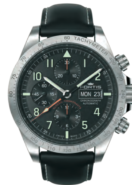
Classic Cosmonauts Steel p.m.

42mm Edelstahlgehäuse · verschraubte Drücker · erhabene grüne Indexe und Zahlen mit Superluminova-Füllung grün nachleuchtend · schwarze Zeiger mit Superluminova-Füllung grün nachleuchtend · silber-opalines Ziffernblatt mit Sonnenschliff · abgesetzte gerillte Compteur-Ziffernblätter · Schweizer Automatikwerk Valjoux 7750 elaboré · Edeltstahlhülente mit Tachymetrie · Chronograph · Tages- und Datumsanzeige · Glasboden · beidseitig entspiegeltes Saphirglas · 10 bar wasserdicht