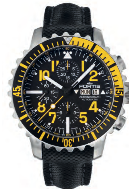
Marinemaster Yellow Chronograph

42mm Edelstahlgehäuse (gebürstet) · rutschfeste Drehlunette mit Superluminova-Punkt · Schweizer Automatikwerk ETA 2836 elaboré · Tages- und Datumsanzeige · gelbe Zahlen, weiße Indexe und Zeiger mit Superluminova-Beschichtung blau nachleuchtend · gelber Sekundenzeiger mit Bullauge Superluminova beschichtet · matt schwarzes Ziffernblatt · beidseitig entspiegeltes Saphirglas · Stahlboden mit FORTIS U-Boot Motiv Prägung · 20 bar wasserdicht