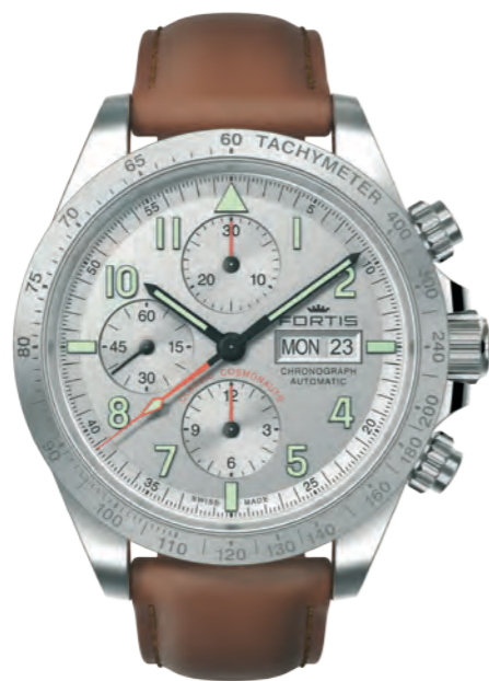
Classic Cosmonauts Steel a.m.