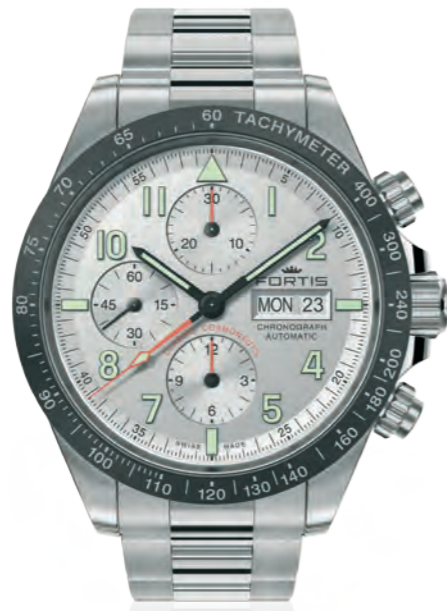
Classic Cosmonauts Ceramic a.m.