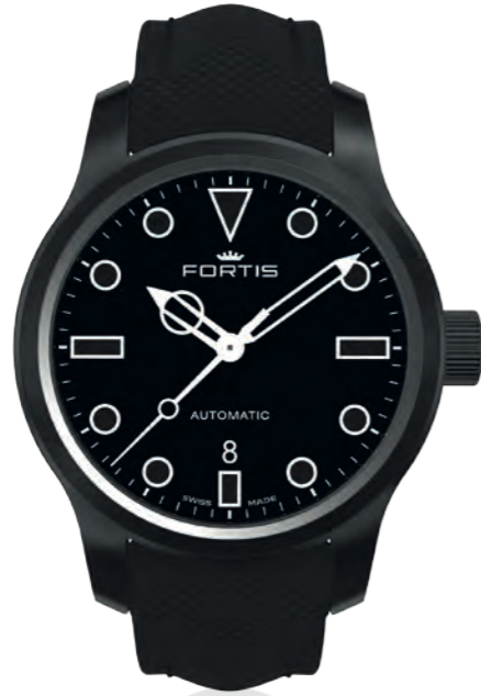
Shoreliner Vik Beach a.m.