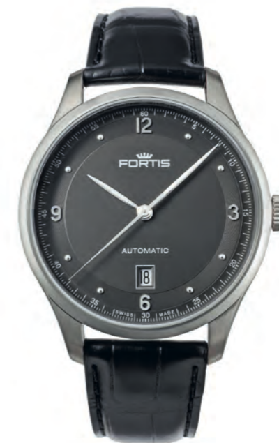
Tycoon Date p.m.

41mm flaches Edelstahlgehäuse (teils gebürstet, teils poliert) · bombiertes Saphirglas · Schweizer Automatikwerk ETA 2892-A2 · bombiertes silber-opalines Ziffernblatt · erhabene Ziffern und Indexe 5N Gold beschichtet · 5N Gold beschichtete Feuille-Zeiger · gebläute Zeiger · Datumsanzeige · verschraubter Glasboden · 5 bar wasserdicht