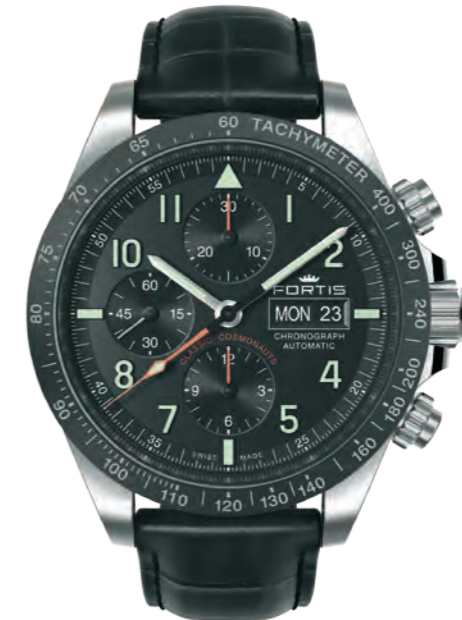
Classic Cosmonauts Ceramic p.m.

42mm Edelstahlgehäuse · verschraubte Drücker · erhabene grüne Indexe und Zahlen mit Superluminova-Füllung grün nachleuchtend · schwarze Zeiger mit Superluminova-Füllung grün nachleuchtend · silber-opalines Ziffernblatt mit Sonnenschliff · abgesetzte gerillte Compteur-Ziffernblätter · Schweizer Automatikwerk Valjoux 7750 elaboré · Keramiklunette mit Tachymetrie · Chronograph · Tages- und Datumsanzeige · Glasboden · beidseitig entspiegeltes Saphirglas · 10 bar wasserdicht