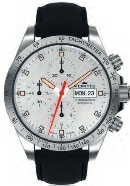
Stratoliner Steel a.m.