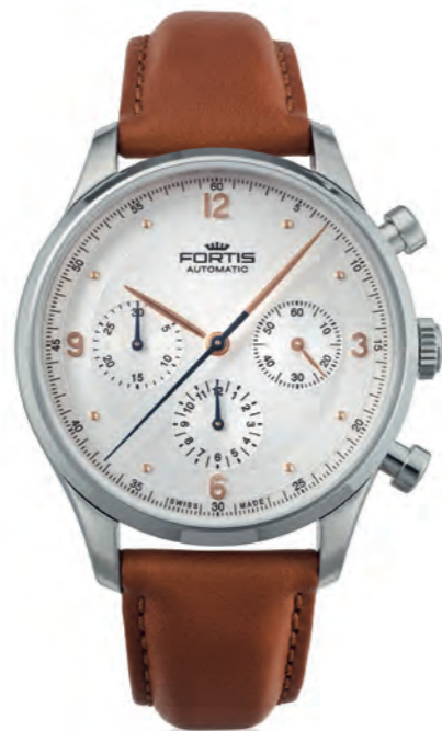
Tycoon Chronograph a.m.