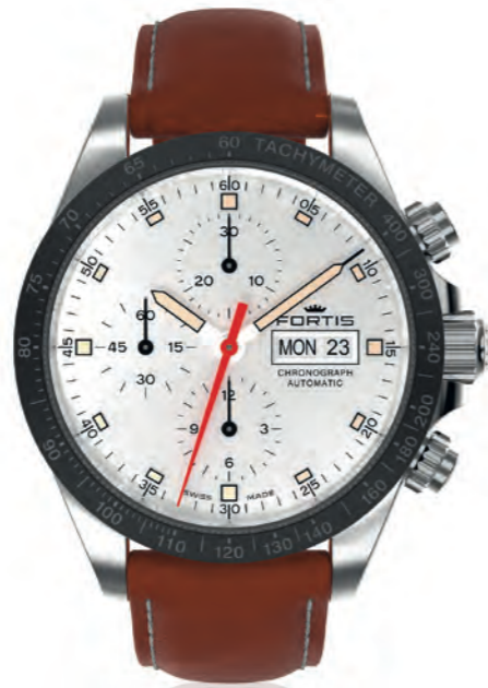
Stratoliner Ceramic a.m.