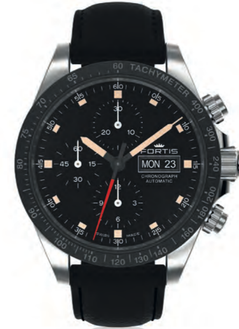
Stratoliner Ceramic p.m.

42mm Edelstahlgehäuse · verschraubte Drücker · erhabene beigefarbene Indexe · beigefarbene Zeiger · matt weißes Ziffernblatt mit Superluminovabeschichtung grün nachleuchtend · durchgehende Compteur-Ziffernblätter · Schweizer Automatikwerk Valjoux 7750 élaboré · Keramiklunette mit Tachymetrie · Chronograph · Tages- und Datumsanzeige · Glasboden · beidseitig entspiegeltes Saphirglas · 10 bar wasserdicht