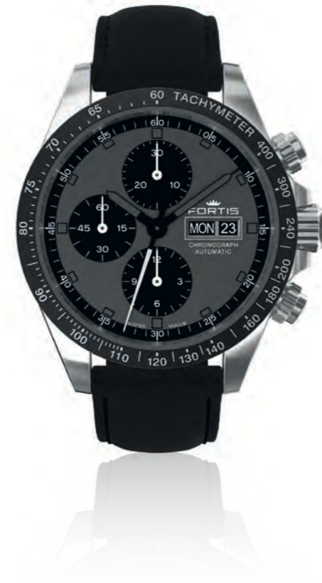
Stratoliner All Black Limited Edition 200 pcs.

42mm Edelstahlgehäuse · verschraubte Drücker · erhabene olivfarbene Indexe · olivfarbene Zeiger · matt weißes Ziffernblatt mit Superluminovafüllungbeschichtung grün nachleuchtend · matt schwarze compteur Ziffernblätter · Schweizer Automatikwerk Valjoux 7750 elaboré · Edeltstahlkürnette mit Tachymetrie · Chronograph · Tages- und Datumsanzeige · Glasboden · beidseitig entspiegeltes Saphirglas · 10 bar wasserdicht