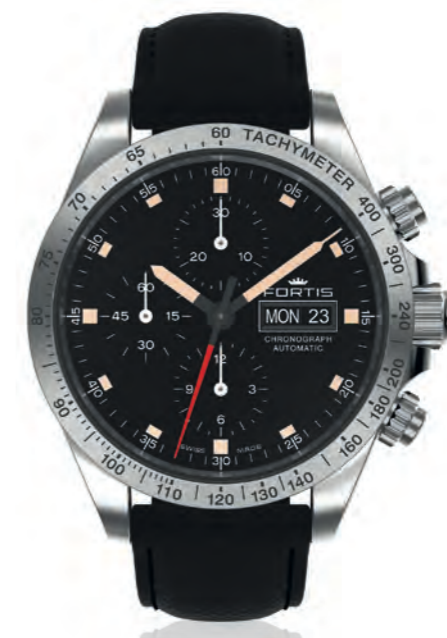
Stratoliner Steel p.m.

42mm Edelstahlgehäuse · verschraubte Drücker · erhabene beigefarbene Indexe · beigefarbene Zeiger · matt weißes Ziffernblatt mit Superluminovabeschichtung grün nachleuchtend · durchgehende Compteur-Ziffernblätter · Schweizer Automatikwerk Valjoux 7750 elaboré · Edeltstahlhülente mit Tachymetrie · Chronograph · Tages- und Datumsanzeige · Glasboden · beidseitig entspiegeltes Saphirglas · 10 bar wasserdicht